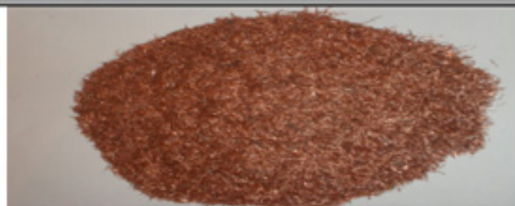
CU 1B Fino