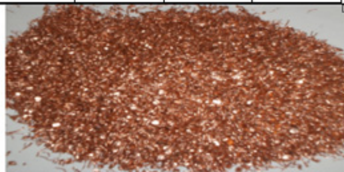
CU Especial Grueso