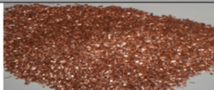
CU 1B Medio