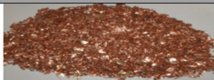
CU 2ª Grueso