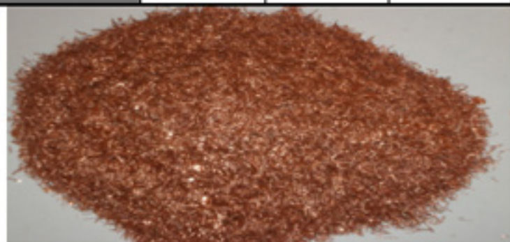
CU Especial Fino